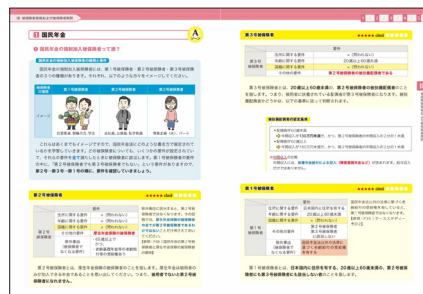
フルカラーテキスト